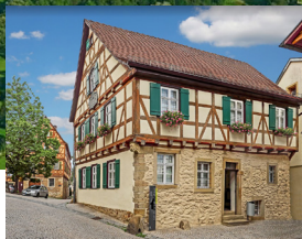
Schillers Geburtshaus in Marbach am Neckar