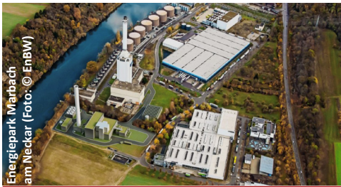
Energiepark Marbach am Neckar