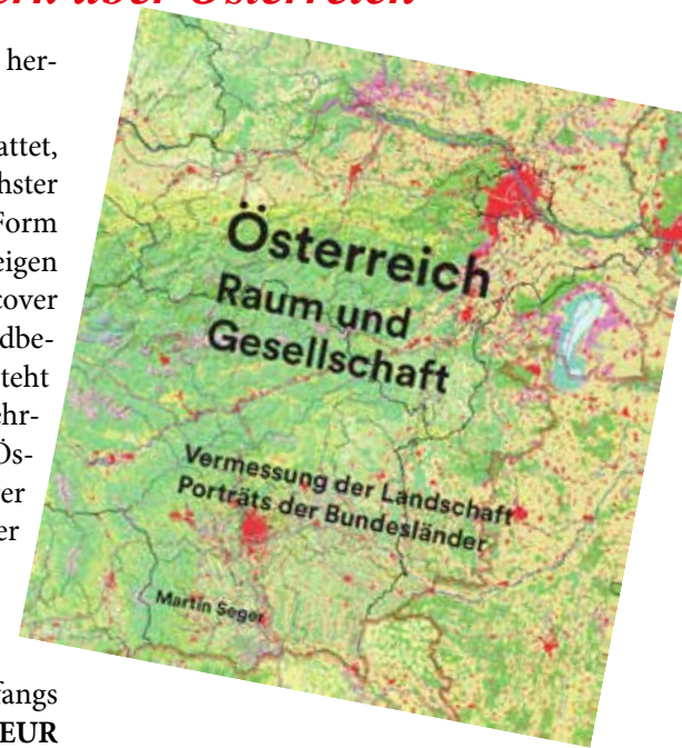
Österreich. Raum und Gesellschaft (Seger 2019)

ÖGG-Mitglieder erhalten bei Bestellung über die ÖGG (E-Mail: oegg.geographie@univie.ac.at) eine Ermäßigung von 10 Prozent (= EUR 35,10, zuzüglich Versandkosten). Um die Versandkosten zu sparen, können ÖGG-Mitglieder das Buch auch in der ÖGG-Geschäftsstelle