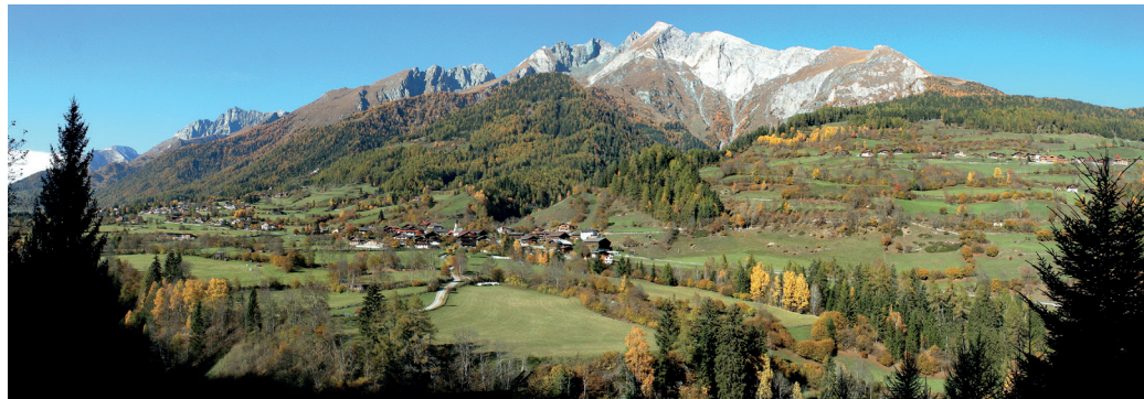
Haufendorf in der Gemeinde Virgen in Osttirol gegen das Hochgebirge im Randbereich der Hohen Tauern (oben) Tertiäres Bildungsniveau der Wohnbevölkerung in Graz, nach Zählsprengeln (rechts) Landnutzung im Raum Krems a.d. Donau (unten) (Quelle: Seger 2019)