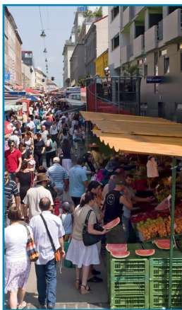
◁ Brunnenmarkt in Wien

Die Geographie fragt nach den räumlichen Kontexten aktueller Entwicklungen – etwa der Globalisierung, der Migrationsbewegungen oder neuer Technologien. Humangeographische Forschung ist von der Idee getragen, dass gesellschaftliche Entwicklungen nur dann erklärbar sind, wenn sie in ihrem räumlichen Kontext erfasst werden.