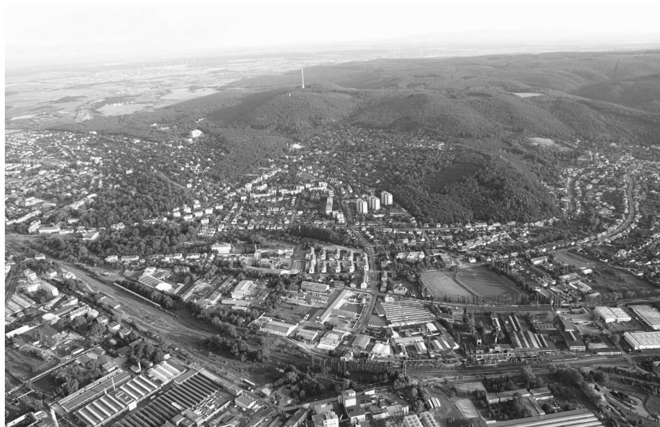
Abb. 2: Der westliche Teil von Ödenburg. Im Vordergrund Industriestandorte; in der Mitte die Wohnsiedlungen in der Ibolya utca und in der Felsőlövért út, rechts Wandorf [Sopronbánfalva]