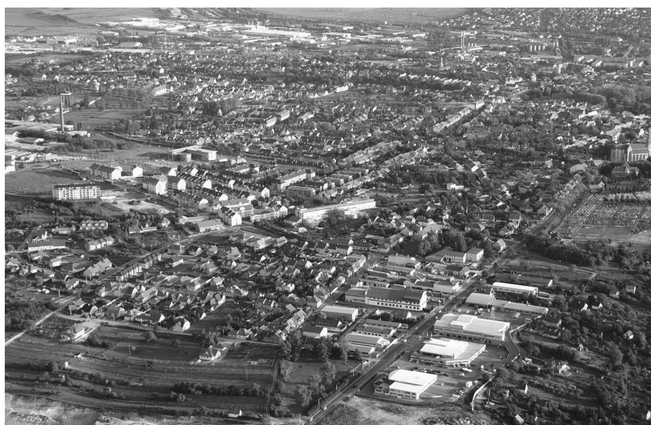
Abb. 3: Der nördliche Teil von Ödenburg. Im Vordergrund die Gewerbezone Nord; in der Mitte neue Wohngebiete von Arany-hegy; rechts die St.-Michaelis-Kirche [Szent Mihály templom]